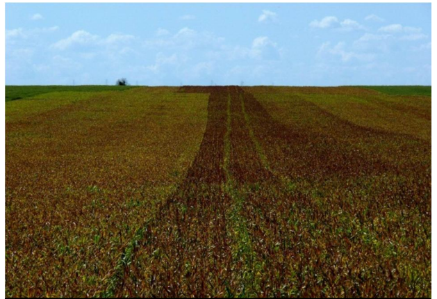
Graminacid fitotoxicitás kalászoló gabonában.

A növényvédelemmel foglalkozók közül valószínűleg már mindenki találkozott a permetezőgép nem megfelelő tisztításából eredő fitotoxicitással. Ez a jelenség a gyakori kultúraváltás miatt a tavaszi növényvédelmi szezon egyik jellegzetessége. A grammos dózisban is hatékony gyomirtó készítmények elterjedése és a speciális adjuvánsok egyre fokozódó használata tovább nehezítette ezt a kérdést. Ismertek olyan készítmények, amelyek kimondottan nehezen távolíthatók el a tartály faláról és a szórófejekről, ahol a régóta használt Hypo, vagy trisó már kevésnek bizonyul a tisztításhoz. Ekkor érkezik el a Farmclean ideje, ami egyike azon kevés készítménynek, amely szakmai és környezetvédelmi szempontból is maradéktalanul megfelel az elvárásoknak. A Farmclean egy speciális „mosószer”, aminek összetevői alkalmasak arra, hogy az előírt felhasználási módszertan betartása mellett a permetezőgép tartályából, illetve a teljes rendszerből (szűrőház, szűrő, csőrendszer, szórófej) eltávolítsák a hatóanyag-maradékokat. A mosáshoz felhasznált víz, a mosólé visszapermetezhető a kezelt kultúrára, annak veszélye nélkül, hogy az károsodna.