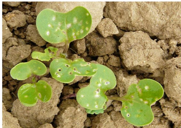
Nagy repcebolha és kártétele

Maradva még a rovarkártevőknél, érdemes odafigyelni a repcedarázs álhernyójának kártételére is, ami a hosszú, meleg őszökön szinte biztosan bekövetkezik. Az ellene való védekezés viszonylag egyszerű, azt kontakt hatású készítményekkel is eredményesen tehetjük meg. Ebben a kategóriában az Arysta kínálatában két terméket találunk. A Cyperkill 25 EC (250 g/l cipermetrin) piretroid-típusú készítmény, aminek engedélyezett dózisa 0,15 l/ha. A Markate 50 ( 50 g/l lambda-cihalotrin) készítmény új termék az Arysta ajánlatában,