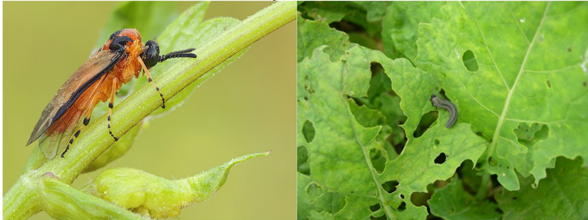
Repcedarázs imágó, álhernyó és annak kártétele

aminek hatásmódja kontakt, taglózó. A készítmény egyik fontos tulajdonsága az EC formuláció, ami a „friss”, kontakt hatáskifejtést erősíti.