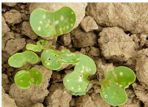
Nagy repcebolha és kártétele

Maradva még a rovarkártevőknél, érdemes odafigyelni a repcedarázs álhernyójának kártételére is, ami a hosszú, meleg őszökön szinte biztosan bekövetkezik. Az ellene való védekezés viszonylag egyszerű, azt kontakt hatású készítményekkel is eredményesen tehetjük meg. Ebben a kategóriában az Arysta kínálatában két terméket találunk. A Cyperkill 25 EC (250 g/l cipermetrin) piretroid-típusú készítmény, aminek engedélyezett dózisa 0,15 l/ha. A Markate 50 ( 50 g/l lambda-cihalotrin) készítmény új termék az Arysta ajánlatában,